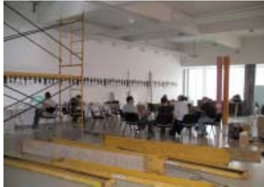
1 1 > L(H)Abitaciones a pleno rendimiento

Se han utilizado recursos como la autoconstrucción, la apropiación (y no la adquisición) o la reutilización de espacios en desuso. Ahora les queda el trabajo más complicado: recopilar y analizar el trabajo, seguir pensando y tratar de sacar conclusiones útiles. Si quieres saber más, www.arteleku.net .