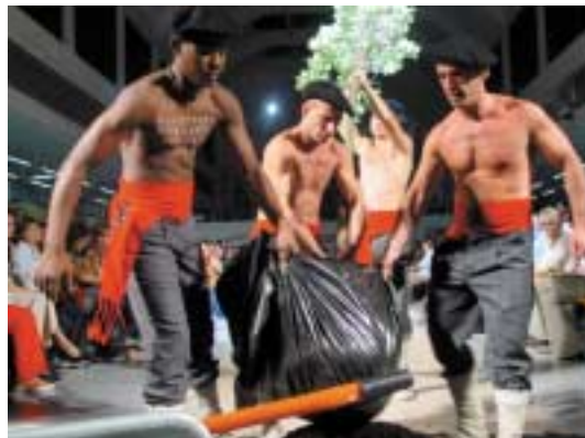
1 1 > MYTHS de Ainara Garcia

Puestos a elegir nos quedamos con la primera edición de Modorra en el Mercado de La Ribera. Un intento de huida hacia delante en una ciudad, en general, muy tradicional en el vestir. Desfiles variados que trataron de no ser sólo desfiles, diseñadores y revistas mostrando sus productos frescos en los puestos del mercado y sobre todo, mucho entusiasmo amateur. Lo mejor, gente corriente haciendo de modelo. Incluso nos dejaron desfilas a nosotros. www.modorra.org .